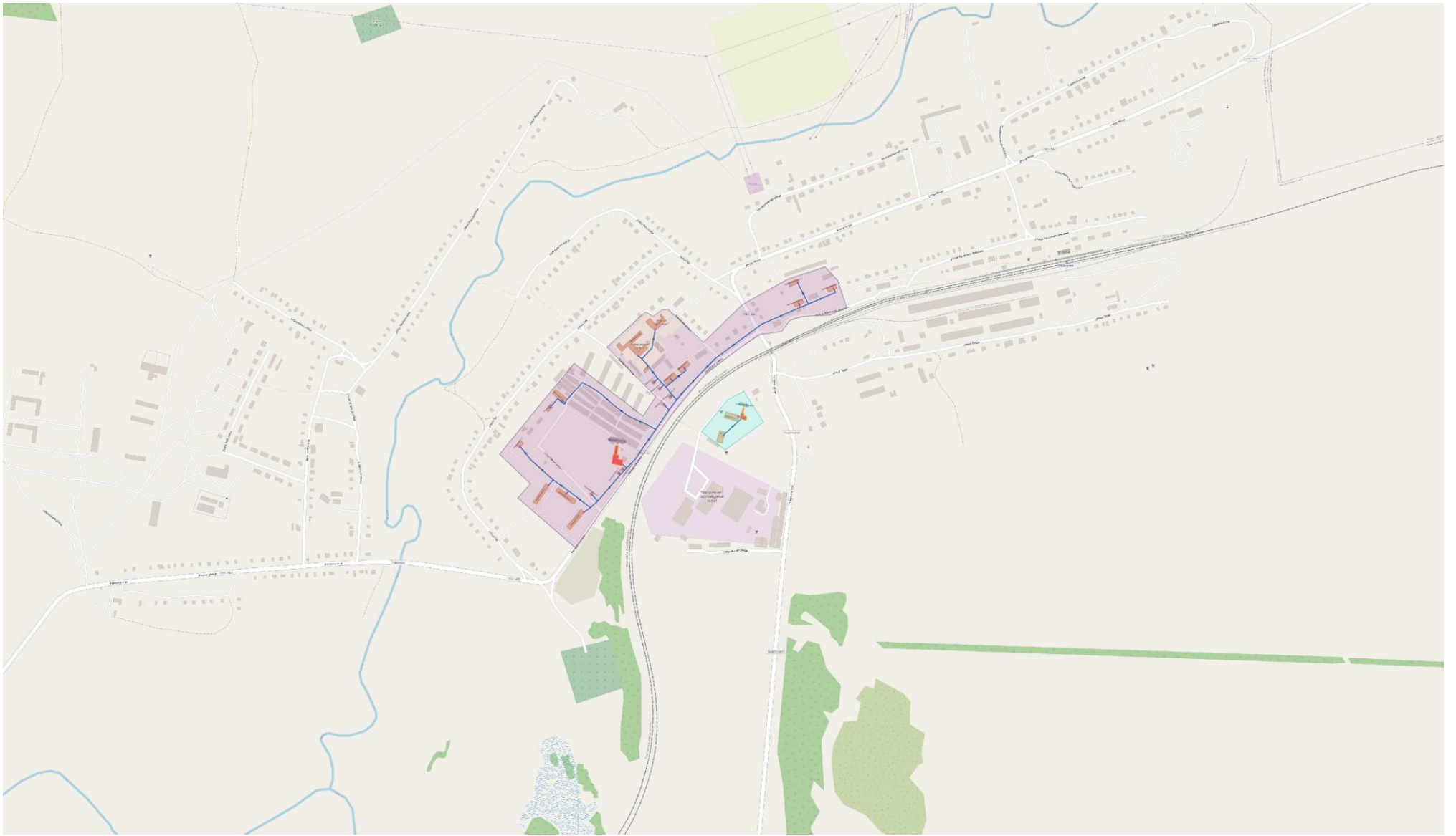
Рис. 2 – Зона действия котельных г.п. Чуфарово